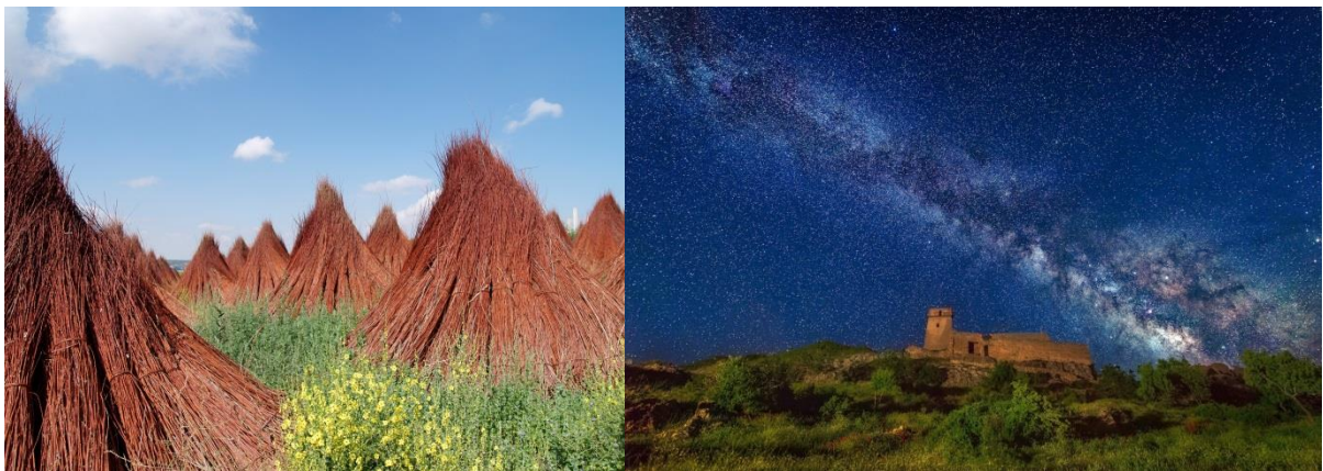
Fotos: Mimbre en la Serranía de Cuenca (izqda.) y Castillo de Taibona o Taibilla, en Sierra del Segura (dcha.)

Turismo Sostenible, o el Sistema de Reconocimiento de la Sostenibilidad Turística en espacios protegidos de la Red Natura 2000 . Este sistema es una de las actuaciones incluidas en el Plan Sectorial de Turismo de Naturaleza y Biodiversidad 2014-2020 (RD 416/2014) y supone una vía para que las empresas turísticas ubicadas en la Red Natura 2000 se diferencien y vinculen al producto Ecoturismo en España. Uno de los objetivos del presente proyecto es la posterior integración voluntaria de estos destinos y empresas de estas 9 comarcas en el Club de Ecoturismo en España. ( www.soyecoturista.com ).