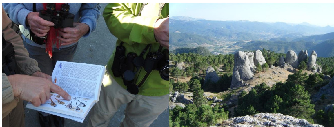
Fotos: Interpretación ambiental (izqda.) y Los Calares del río Mundo desde Los Picarazos (dcha.)