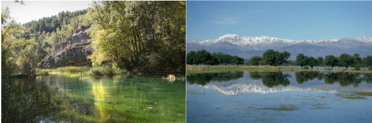
Fotos: Alto Tajo (izqda.) y Embalse de Navalcán (Campana de Oropesa. Toledo) (dcha.)

reconocimiento de la sostenibilidad turística Red Natura 2000, con carácter innovador, demostrativo y exportable.